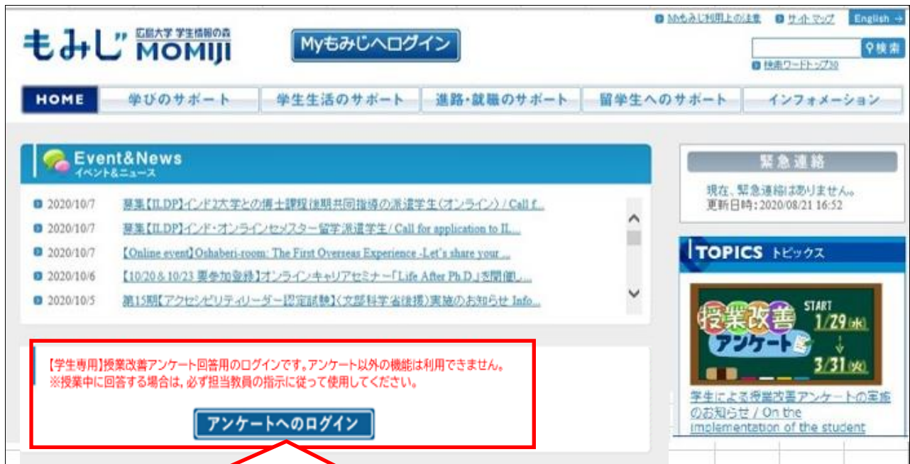
図1：もみじ Top の「アンケート回答専用ログイン口」設置場所