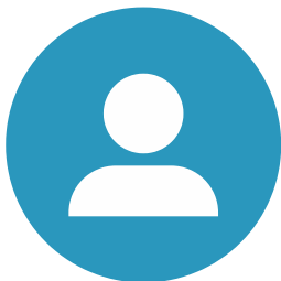
[講師] 株式会社 日本政策金融公庫 広島支店 国民生活事業融資第三課