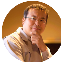
[講師] 株式会社Zen 代表取締役 J-Startup West Supporter

あなたの商品を“ほしい人”にしっかり届ける方法を、基礎からわかりやすく学びます。 (ワーク)モノ売りではなくコト売りのストーリー作り