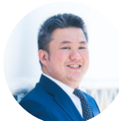
[ファシリテーター] Hi-Biz センター長

東広島の先輩起業家による パネルディスカッションを行います。 創業をリアルに感じましょう！