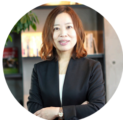
[講師] 株式会社 フィールドマネジメント

「強みと価値観を深掘りし、やりたいことを事業のカたちへ整える実践ワーク」を行います！